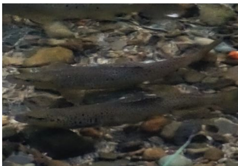
Pstruzi na trdlišti v chráněné rybí oblasti